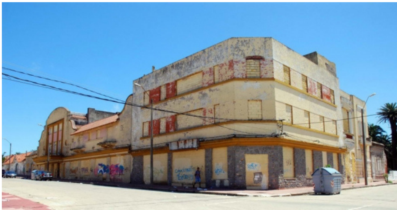
Complejo arquitectónico que abrigó el Cine Ocean antes de su demolición.

Edición y diseño: Facundo Bianchi, Gabriela Campodónico y Mariciana Zorzi. Docentes Área de Estudios Turísticos (CURE).