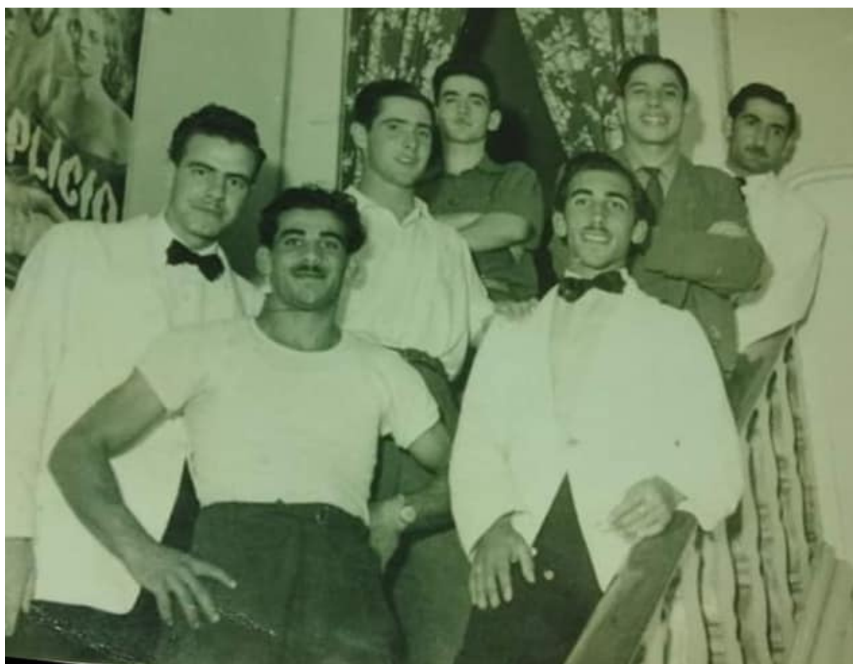
Trabajadores del Cine Ocean. Fuente: Luis Silvera. Grupo de Facebook de la Punta de Punta Soy.