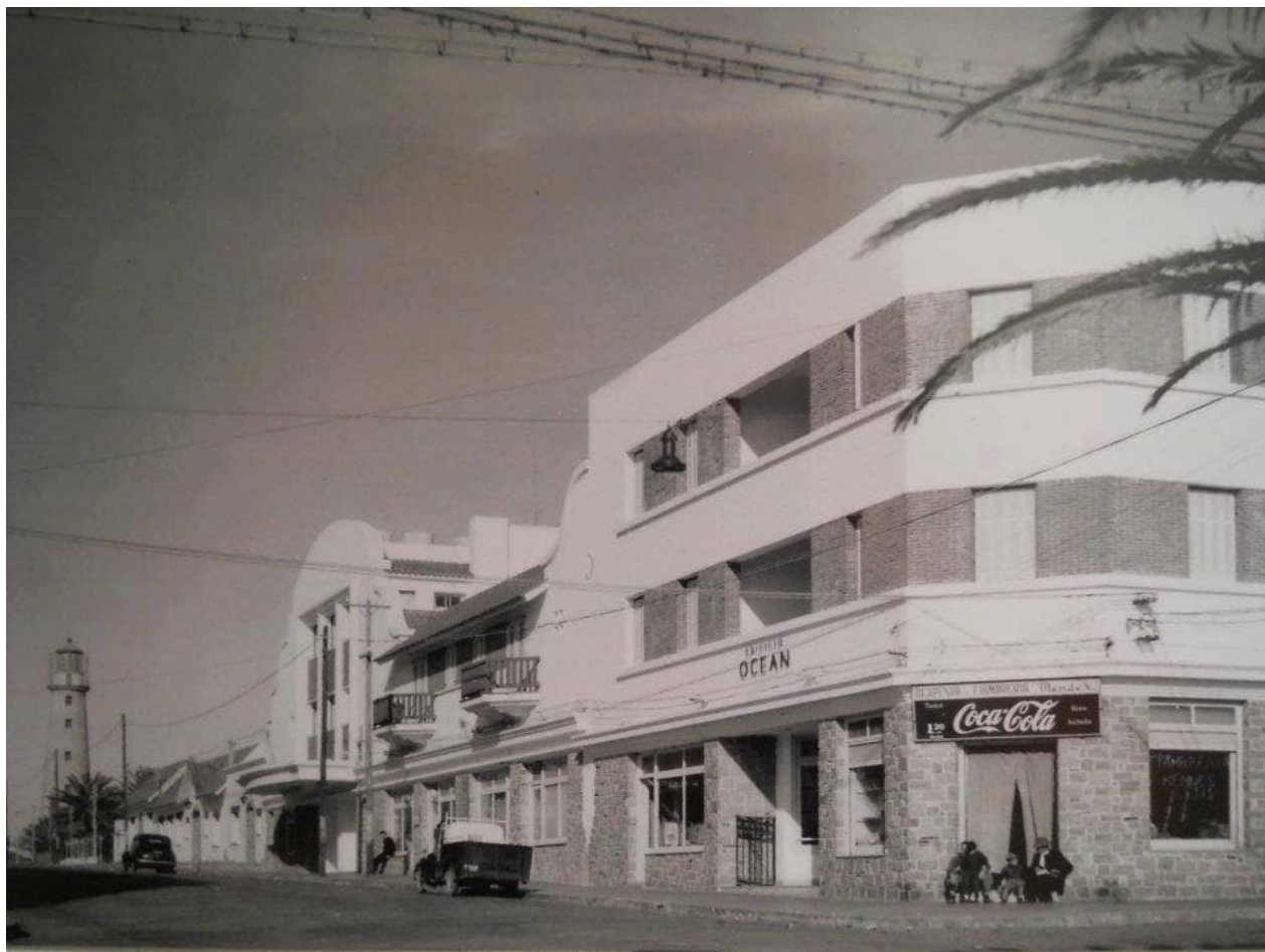
Foto del antiguo complejo arquitectónico, al fondo el Faro.

El histórico complejo que abrigó al Cine Ocean fue demolido en octubre de 2015, ya que, según se pudo leer en noticias de prensa, el mismo estaba plagado de ratas, su estructura también estaba comprometida.