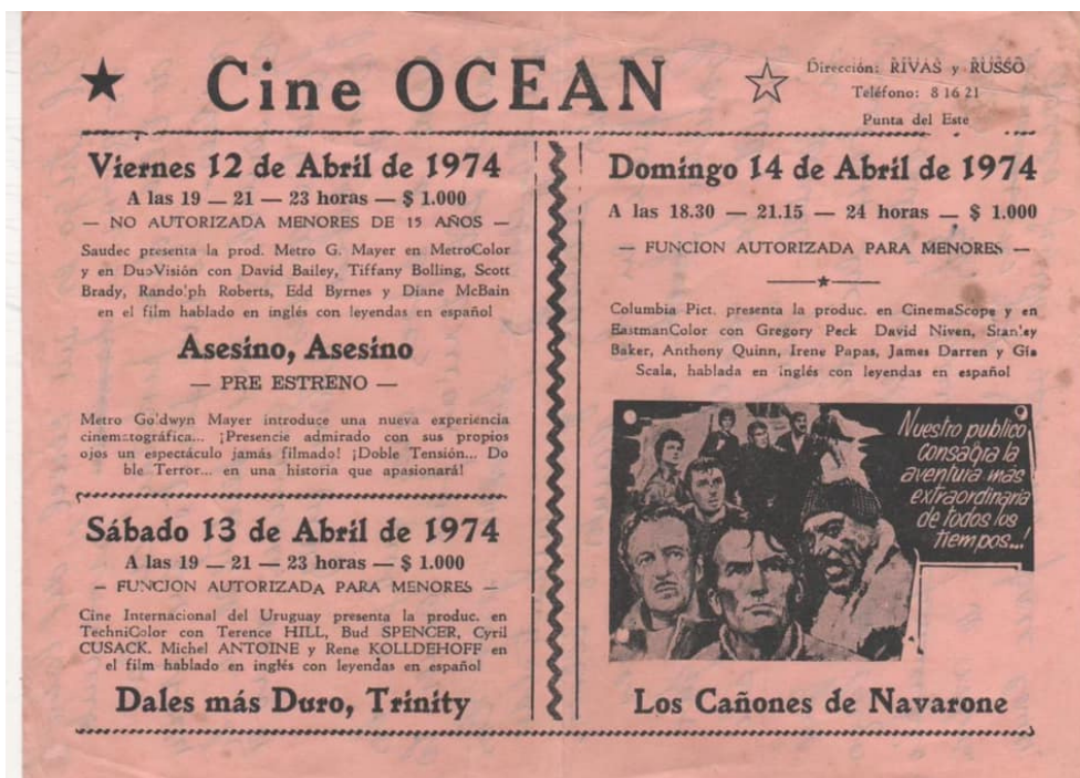
Programación del Cine Ocean.