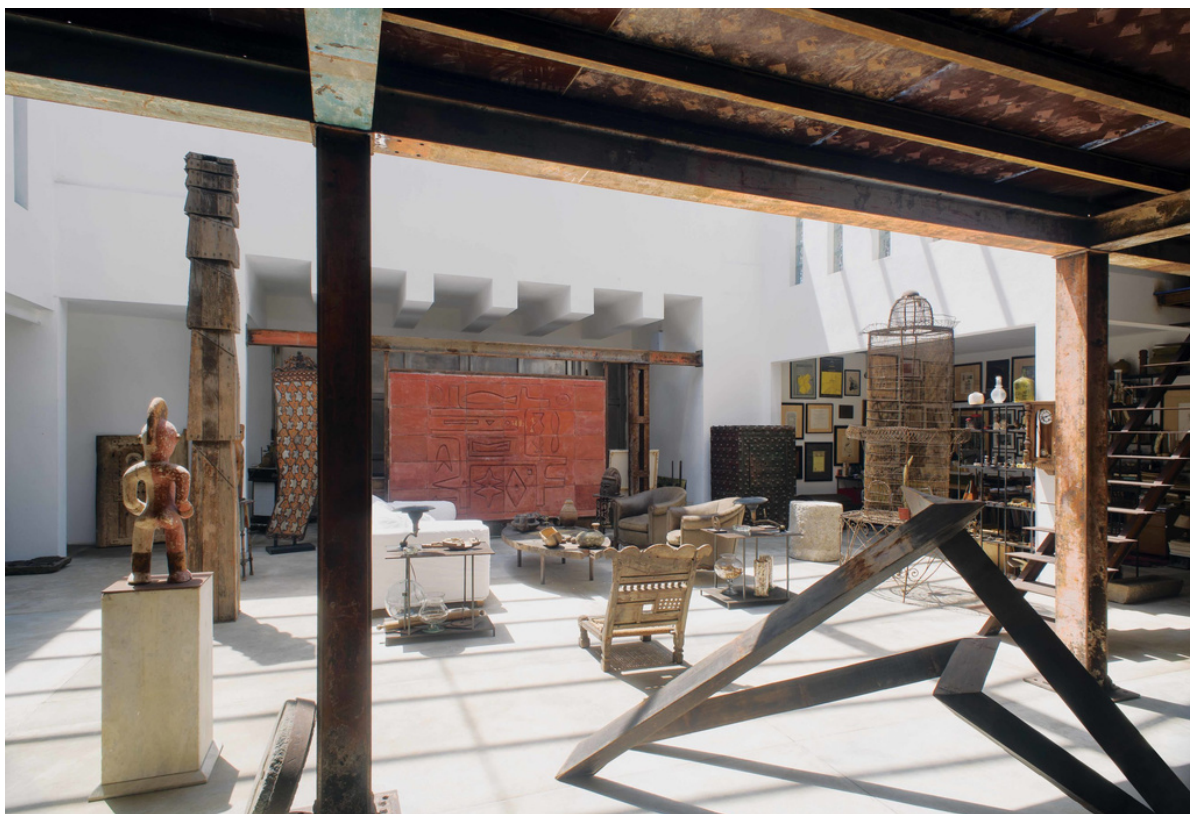
Interior del ex Garaje Modelo, utilizado como vivienda.