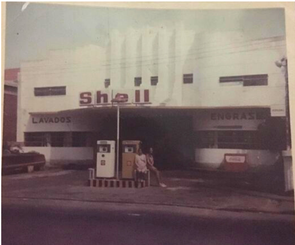
Vista de la Estación de Servicios, años 1970.