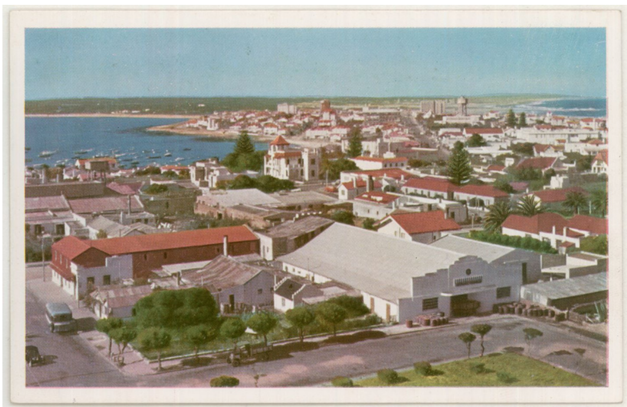
Garaje Modelo vista desde el Faro.