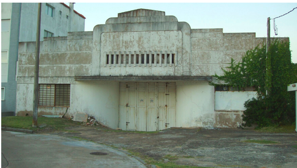
Segunda entrada del Garaje.