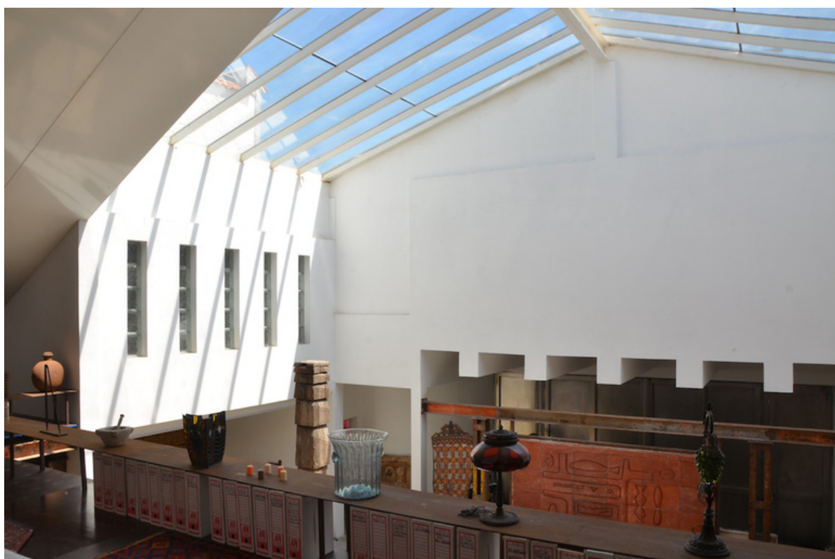
Interior del ex Garaje Modelo, utilizado como vivienda.