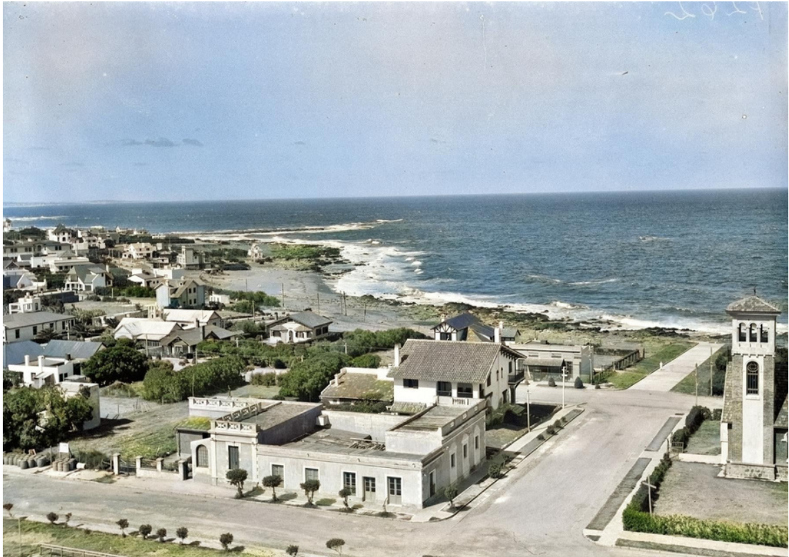
Vista de la Playa de los Ingleses, siglo XX.

Edición y diseño: Facundo Bianchi, Gabriela Campodónico y Mariciana Zorzi. Docentes Área de Estudios Turísticos (CURE).