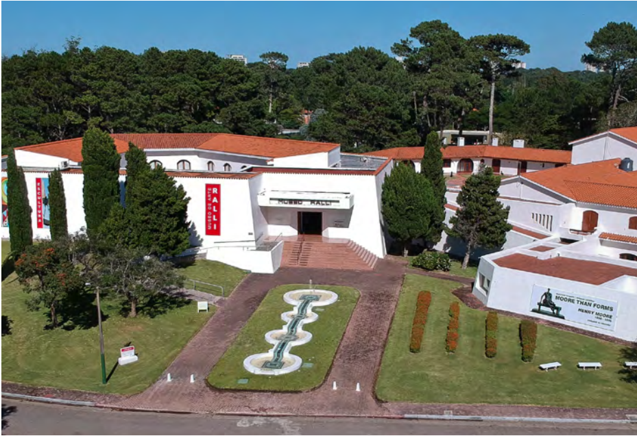
MUSEO RALLI, calle Los Arrayanes, Bo. Beverly Hills, Punta del Este