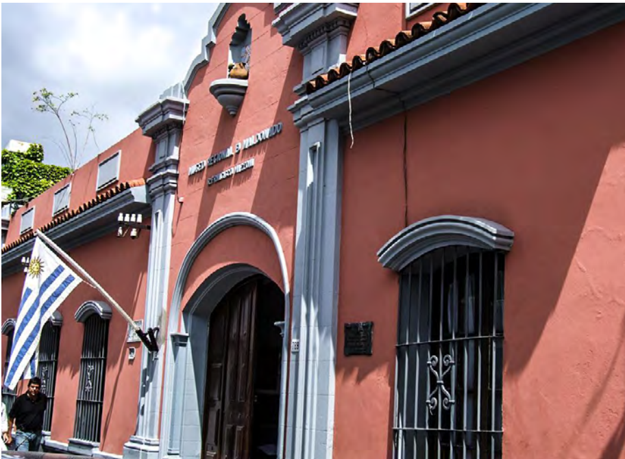
MUSEO MAZZONI, calle Ituzaigo 789, Maldonado