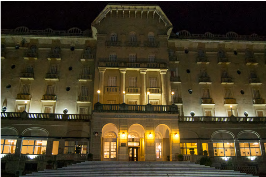
SALÓN DORADO ARGENTINO HOTEL, Rbla. de los Argentinos, Piriápolis