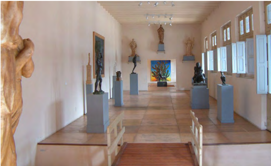
MUSEO GARCÍA URIBURU, calle 25 de Mayo casi 18 de Julio, Maldonado